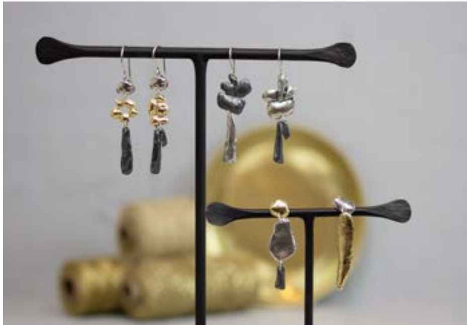
Oorhangers links zilver + zilver verguld 20505 €89 Oorhangers rechts zilver 20487 €89 Oorhangers onderin zilver + zilver verguld 20486 €89