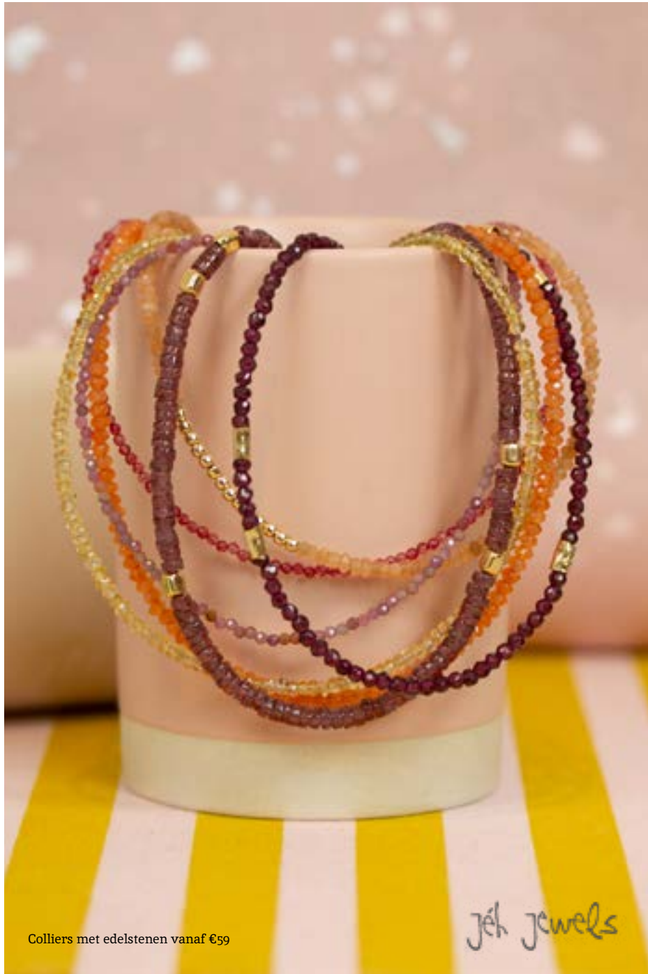
Colliers met edelstenen vanaf €59