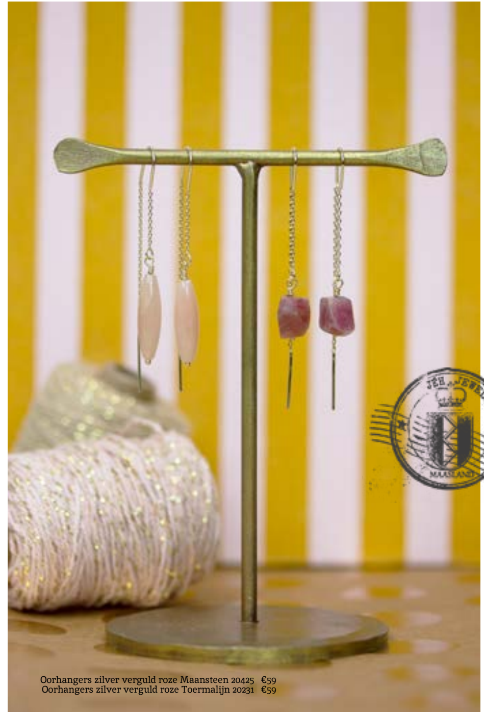
Oorhangers zilver verguld roze Maansteen 20425 €59 Oorhangers zilver verguld roze Toermalijn 20231 €59