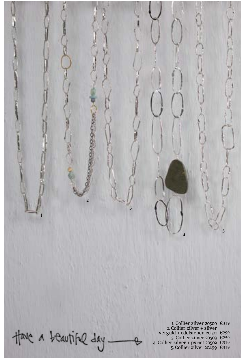
1. Collier zilver 20500 €319 2. Collier zilver + zilver verguld + edelstenen 20501 €299 3. Collier zilver 20503 €259 4. Collier zilver + pyriet 20502 €319 5. Collier zilver 20499 €319