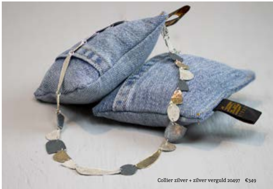
Collier zilver + zilver verguld 20497 €349